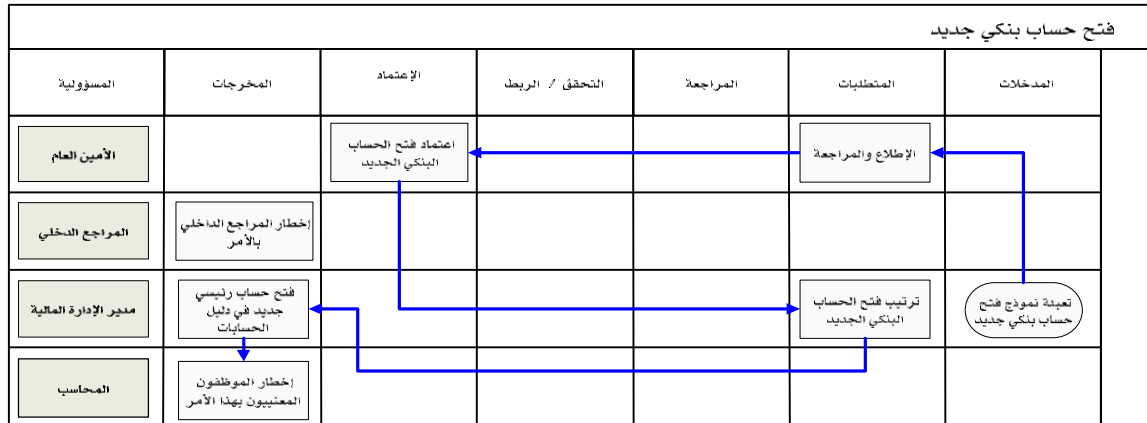
شكل رقم / ١

يوضح المخطط البياني التالي (شكل رقم / ١) طريقة تسلسل العمل لفتح حساب بنكي جديد: